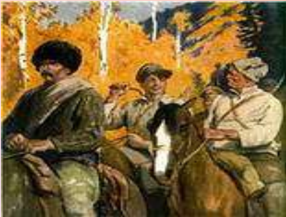
Иллюстрация О. Г. Верейского к роману «Разгром»